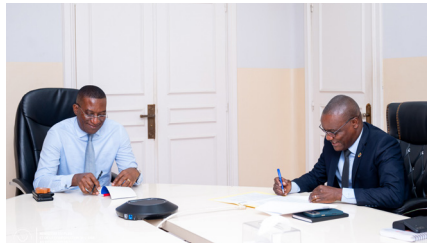
inclusive et d'un mécanisme

Les deux parties ont insisté sur la nécessité d'une communication