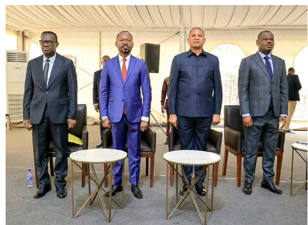
Clôture officielle de l'élaboration du PDP au Haut-katanga et remise du livrable au Ministre Provincial du Plan en présence du Président de l'Assemblée Provinciale et du Gouverneur de Province