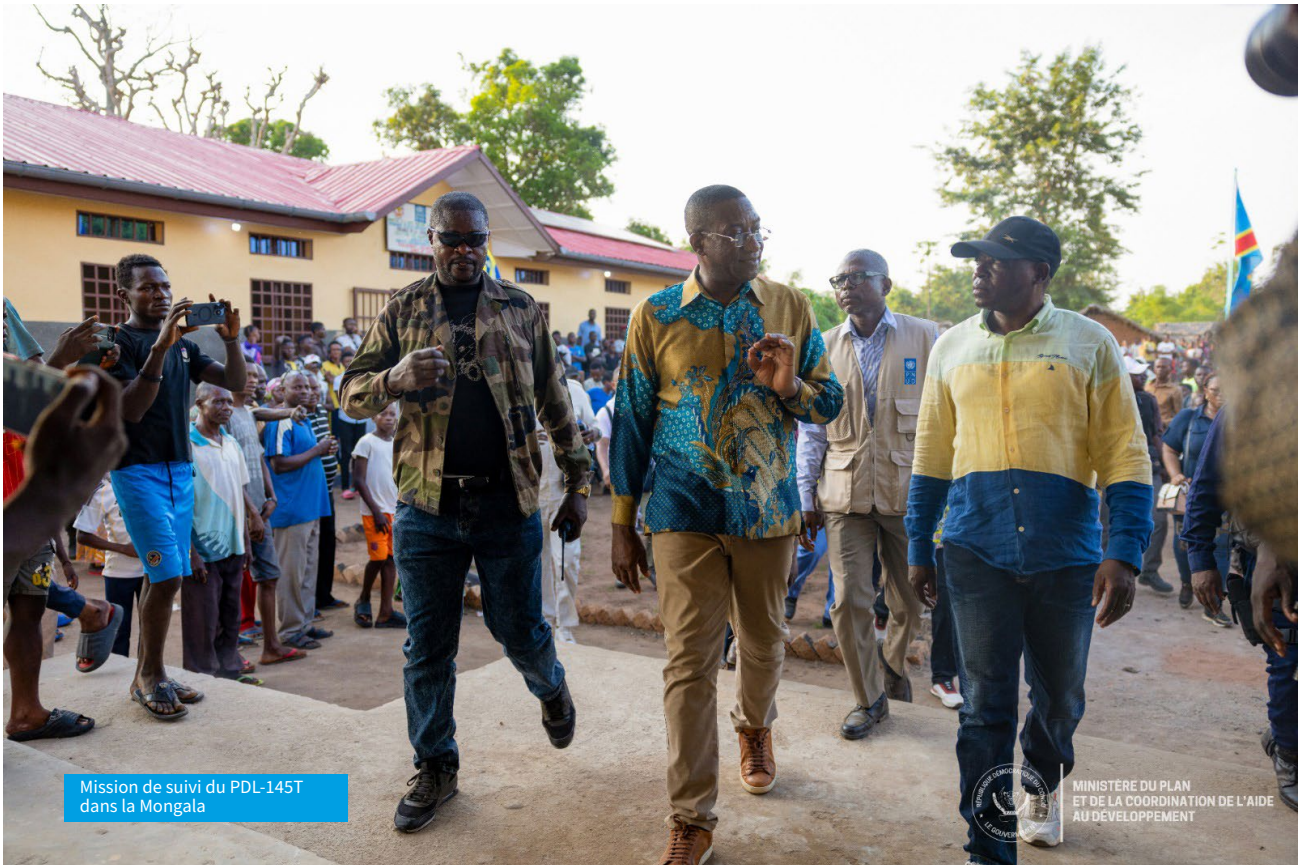
Mission de suivi du PDL-145T dans la Mongala