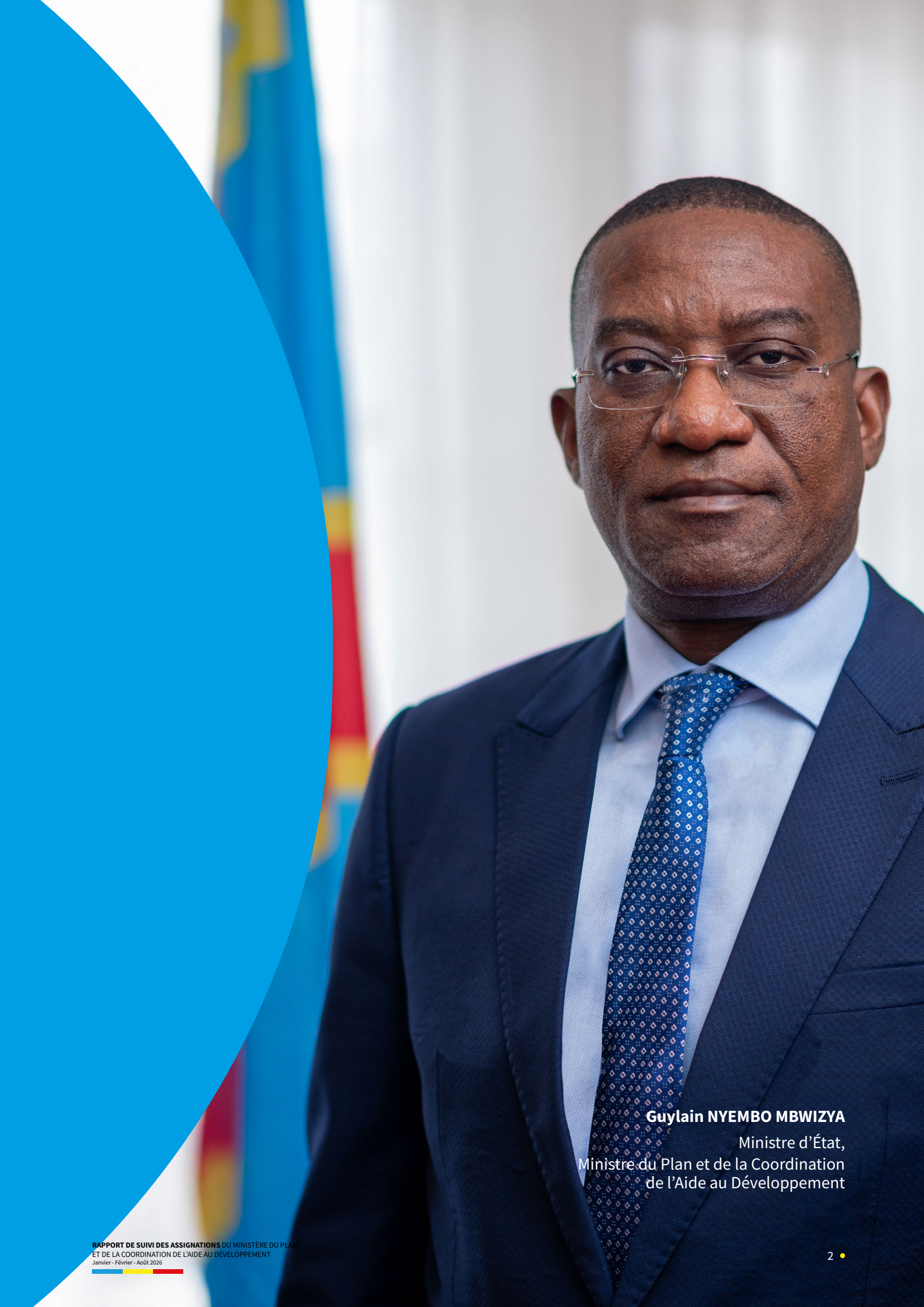
Guylain NYEMBO MBWIZYA Ministre d'État, Ministre du Plan et de la Coordination de l'Aide au Développement